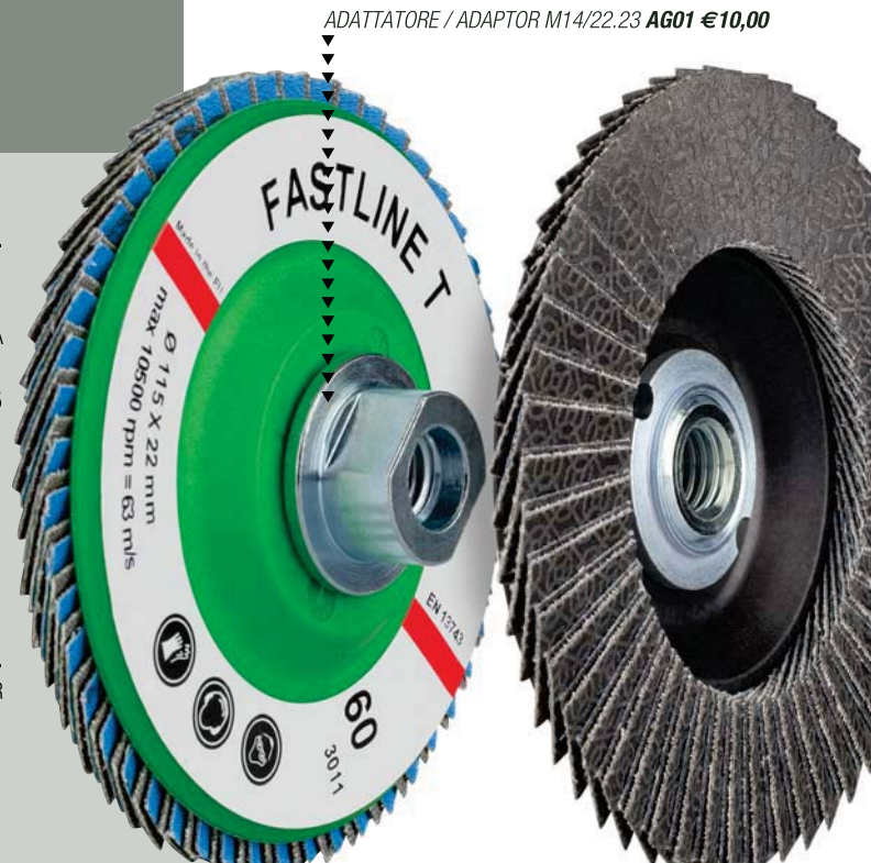
ADATTATORE / ADAPTOR M14/22.23 AG01 €10,00